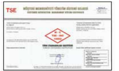
TSE - ISO 10002:2018