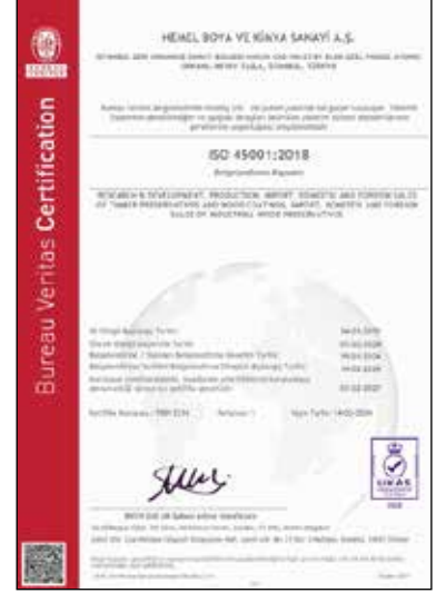
ISO 45001:2018 UKAS