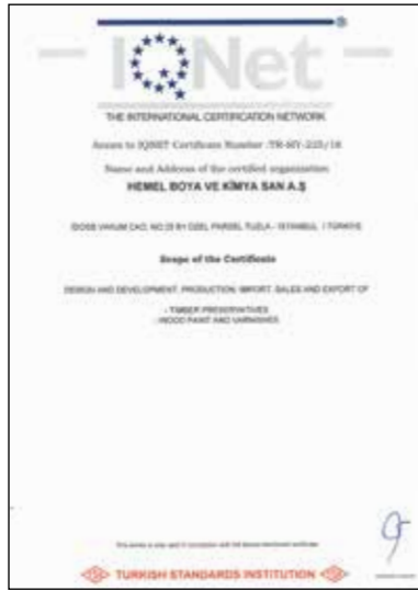
IQNet TS ISO 10002:2018

Satış ve satış sonrası süreçlerimiz TSE-ISO 10002:2018 Müşteri Memnuniyeti Yönetim Sistemi standardına uygun olarak MY-225/18 belge numarası ile sertifikalandırılmıştır.