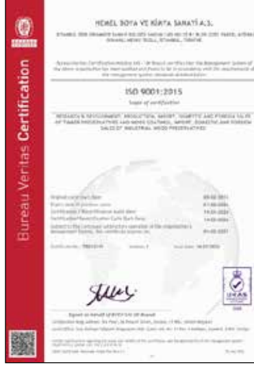
ISO 9001:2015 UKAS

Ürünlerimiz, Bureau Veritas tarafından ISO 9001:2015 / ISO 45001:2018 standardına uygunluğu belgelendirilmiş HEMEL tarafından üretilmektedir.